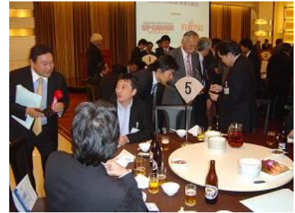
～名刺交換などご交流中～