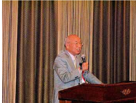
牧本 次生 氏

* 著書に「デジタル革命」、「デジタル遊牧民」、「一国の盛衰は半導体にあり」などがあります。