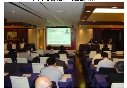
株式公開支援パネルディスカッション