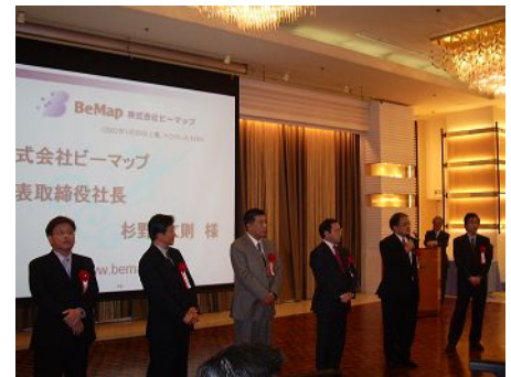
これまでTSUNAMIから上場された企業のご紹介

* 著書に「デジタル革命」、「デジタル遊牧民」、「一国の盛衰は半導体にあり」などがあります。