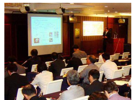
ビジネスプラン発表会↑、交流会↓