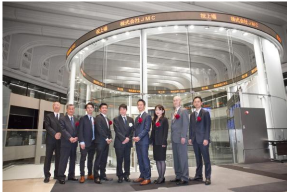
11 월 29 일 (화) 도쿄 증권 거래소 마더스 상장

회사명 : 주식회사 JMC ( URL: http://www.jmc-rp.co.jp/ ) 대표 : 대표이사 CEO 渡邊大知 氏 소재지 : 神奈川県横浜市港北区新横浜 2-5-5 住友不動産新横浜ビル 1F 설립 : 1992年12月18日 자본금 : 691,352,000円 사업내용 : 3D 프린터 출력, 구조, 검사 수탁