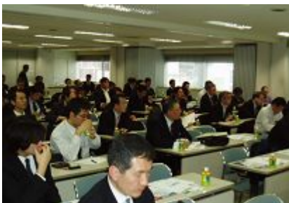
講演に熱心に耳を傾ける参加者(上) 講演後は懇親会が行なわれた(下)